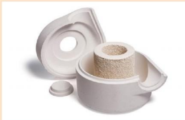
図 2 EXACTFILL チューブ状フィルター用のハウジング

ASKケミカルズは、チューブ状および円筒形のフォームセラミックフィルターの設計を強化することに成功しました。大型および超大型鋳物用の鋳鋼および鋳鉄鋳物の両方で使用できます。よく考えられた構造と形状を組み合わせ、シンプルで安全な取り扱いのために設計されたハウジングシステムにより、より速く、よい効果的な設置が可能になります（図2を参照）。多くの場合、すでに存在する注湯システムを使いながら、ほとんどすべてのアプリケーションに対して、ソリューションとなる多くの可能な組み合わせを提供いたします。