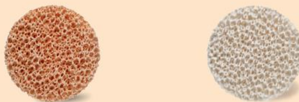
図1 原材料によるUDICELLフォームフィルターの物理特性の比較

ASKケミカルズは、PSZMフィルターを製造できる世界でも数少ないサプライヤーの1つです。